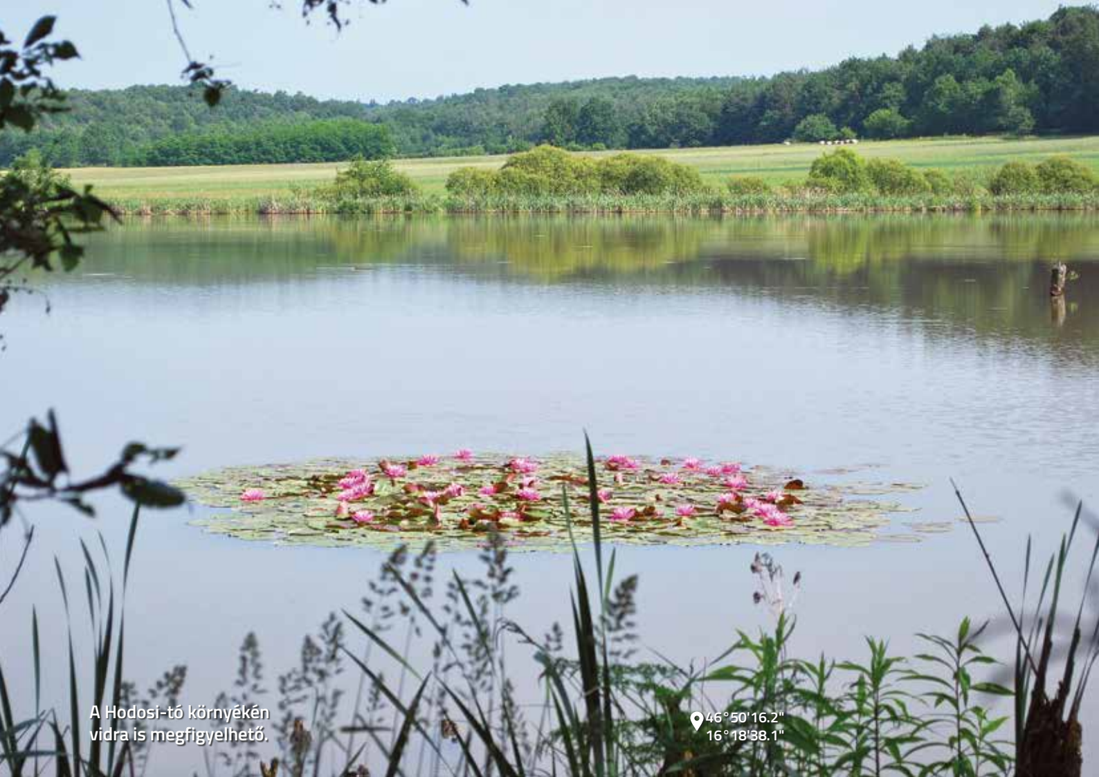
A Hodosi-tó környékén vidra is megfigyelhető.