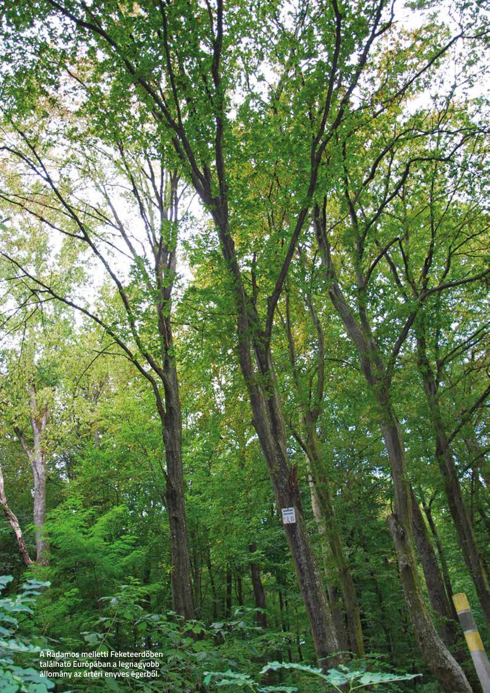
A Radamos melletti Feketeerdőben található Európában a legnagyobb állomány az ártéri enyves égerből.