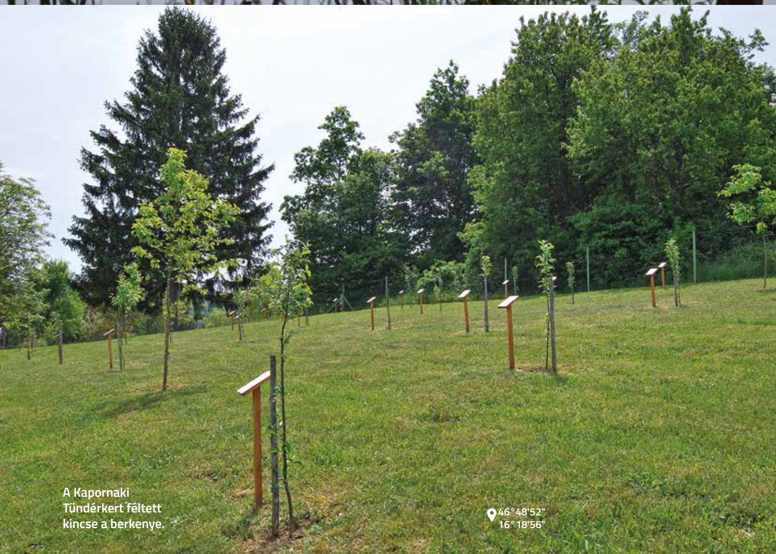
A Kapornaki Tündérgert féltett kincse a berkenye.