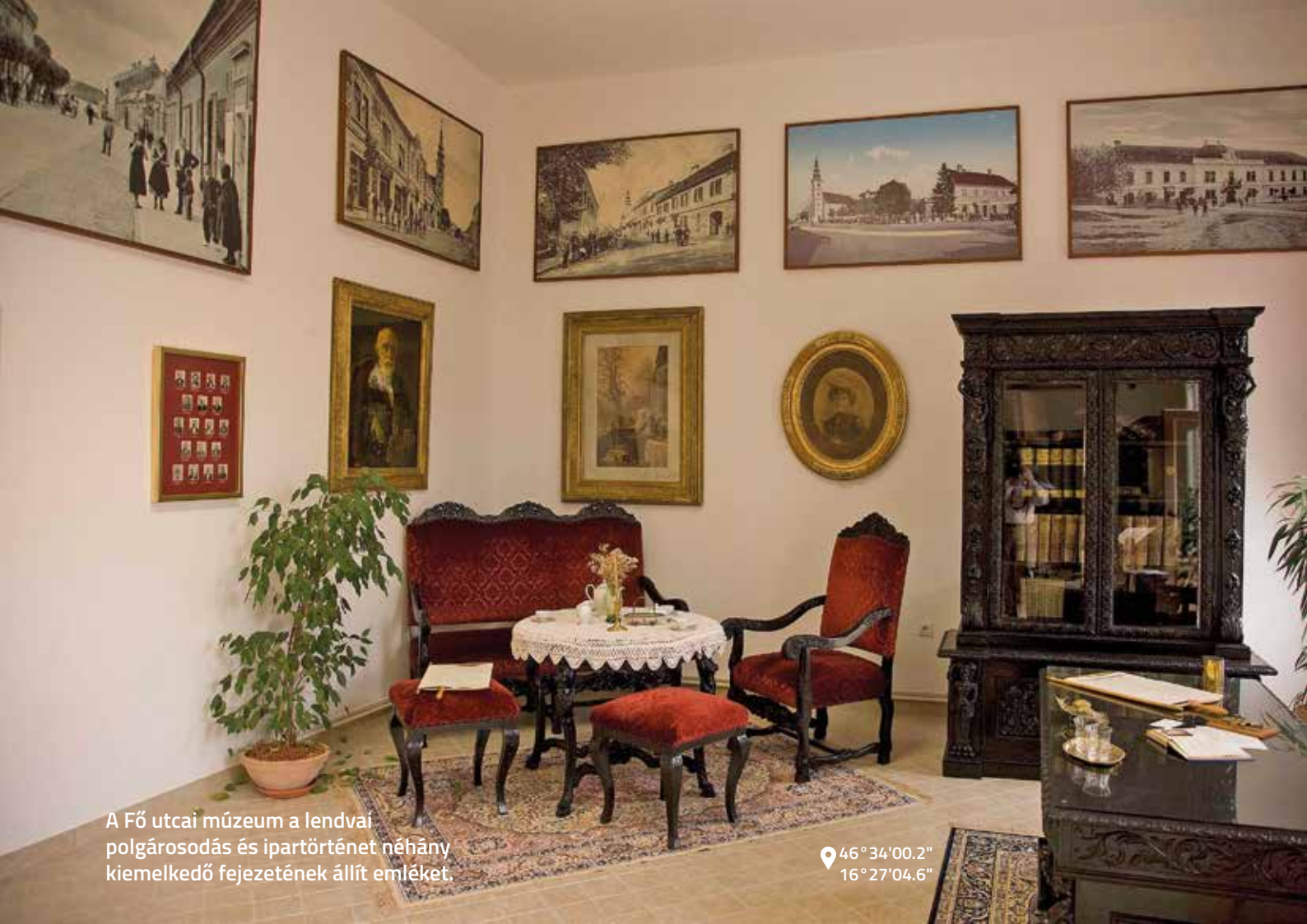
A Fő utcai múzeum a lendvai polgárosodás és ipartörténet néhány kiemelkedő fejezetének állít emléket.